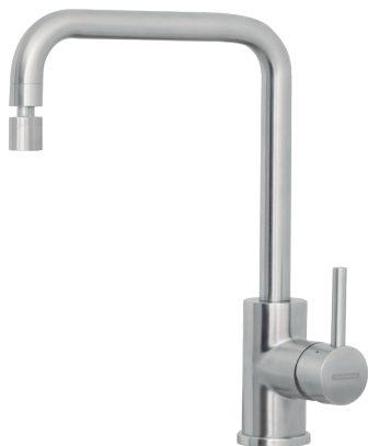
Aço Inox Ref.: 94520/022