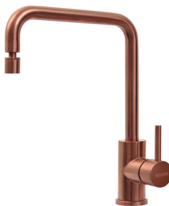
Rose Gold Ref.: 94520/412