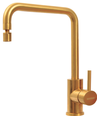
Gold Ref.: 94520/312