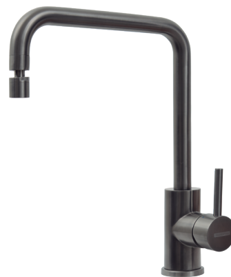
Black Ref.: 94520/512

Revestimento PVD (Physical Vapor Deposition): é um processo para produzir um vapor metálico que é depositado sobre a peça como se fosse uma fina camada colorida.