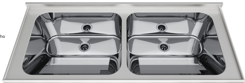
Acabamento Alto Brilho Válvulas 3½"