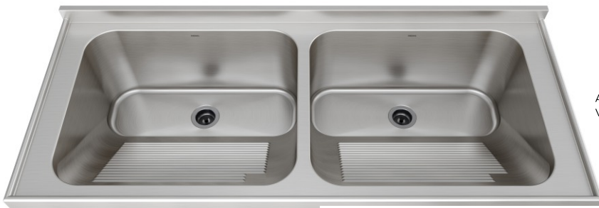
Acabamento Escovado Válvulas 3½"