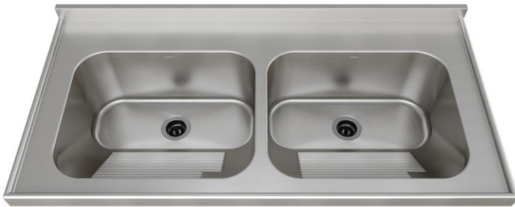
Acabamento Escovado Válvulas 3½"