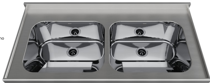
Acabamento Alto Brilho Válvulas 3½"