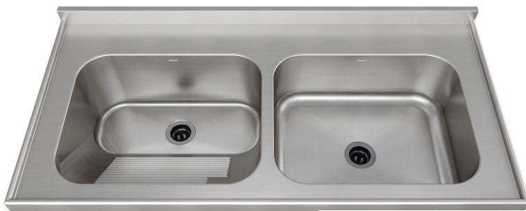
Acabamento Escovado Válvulas 3½"