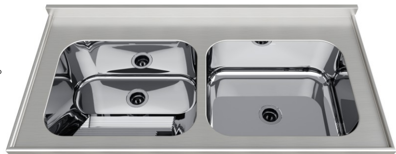
Acabamento Alto Brilho Válvulas 3½"