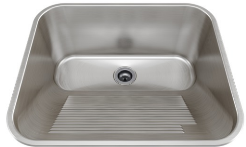
Acabamento Escovado Válvulas 3½"