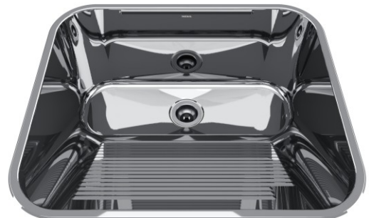
Acabamento Alto Brilho Válvulas 3½"