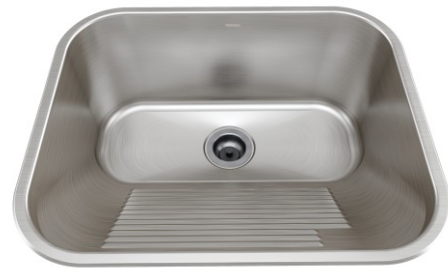
Acabamento Escovado Válvulas 3½"