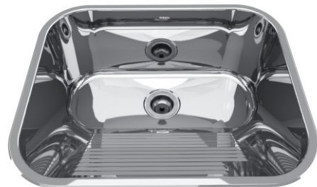
Acabamento Alto Brilho Válvulas 3½"