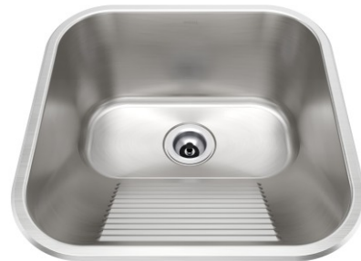
Acabamento Escovado Válvulas 3½"