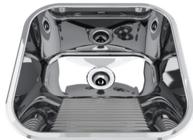
Acabamento Alto Brilho Válvulas 3½"